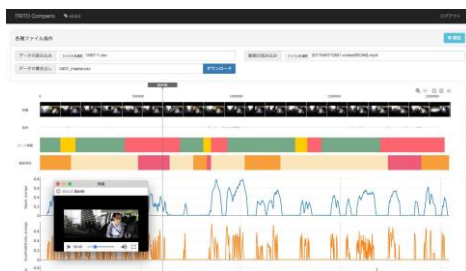
<収集データの分析ツール>